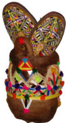
L'artisanat du cuir